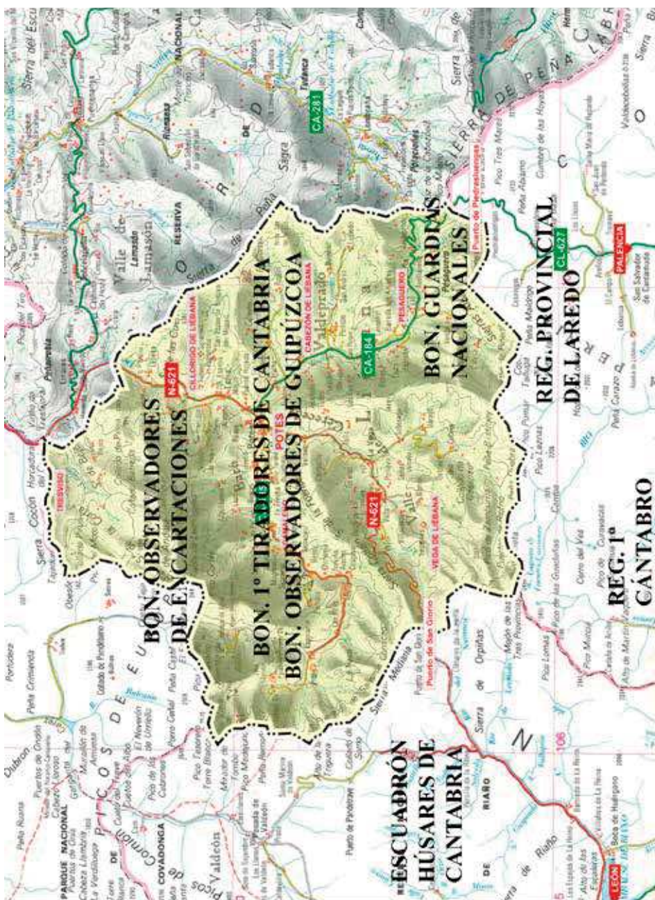
Figura 3. Ubicación de las unidades de la División Cántabra en julio de 1811