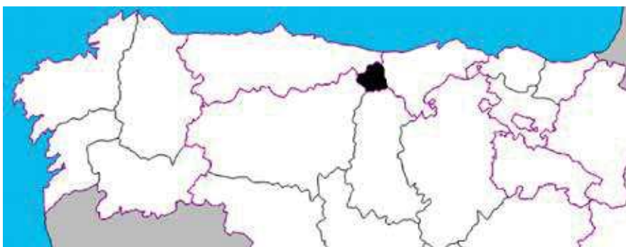
Figura 1. Situación de la comarca de Liébana

efectiva, su ubicación entre Cantabria, León y Asturias (provincias estas dos últimas con fuerte presencia de tropas regulares españolas prácticamente desde el inicio del conflicto) y su peculiar configuración orográfica se revelaron ideales para mantener un activo foco de resistencia patriota en el flanco del potente ejército napoleónico del Norte peninsular.