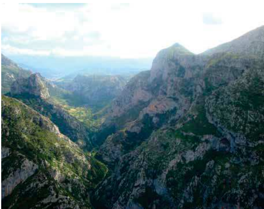
Figura 2. El Desfiladero de La Hermida