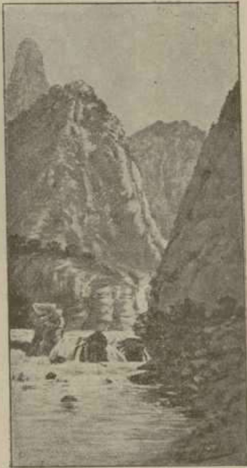
Hoz de Potes.

alma de usurero. Hay, sin embargo, algunas hermosas casas solarietas, y la plaza de soportales es