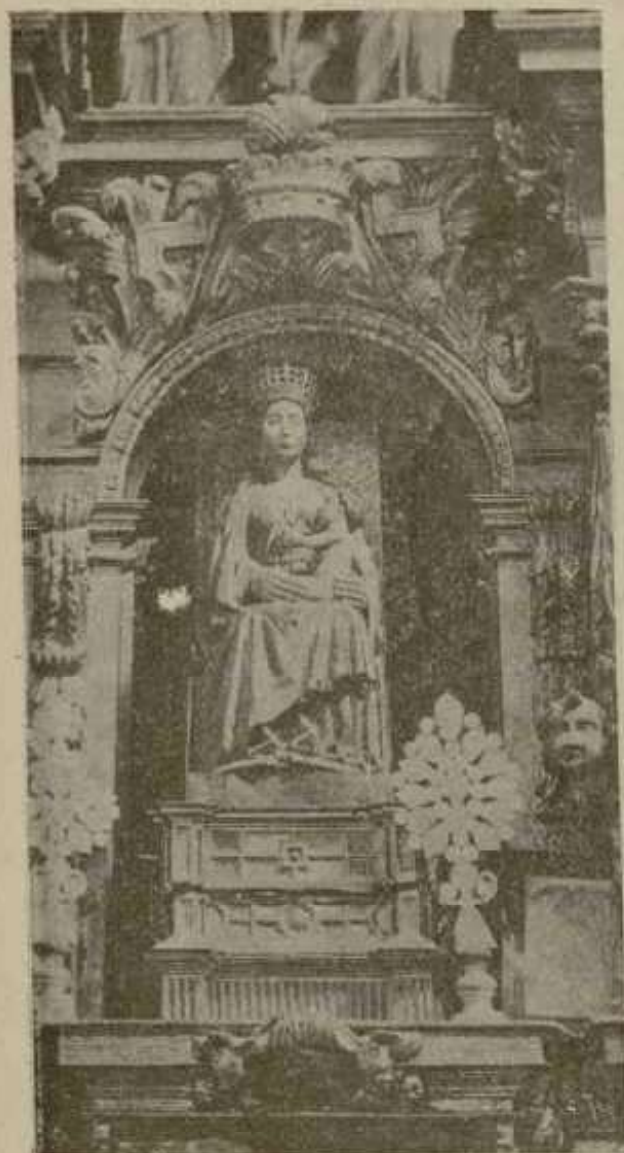
Santa María de Lobeña.

atrás, y después le iba persiguiendo y dándole caza por toda la quebradura, sin cesar de hostigarle con tremendos resoplidos y balbucientes injurias.