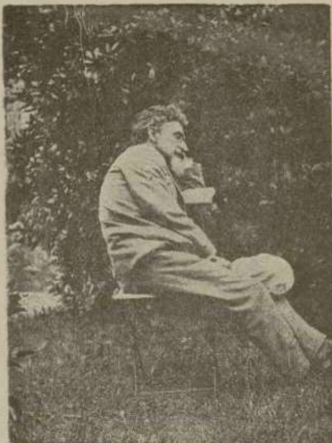
D. JOSE MARÍA DE PEREDA.

traños que no lo conocen; pero no estaba en mí escoger la prueba de consideración más apropia-