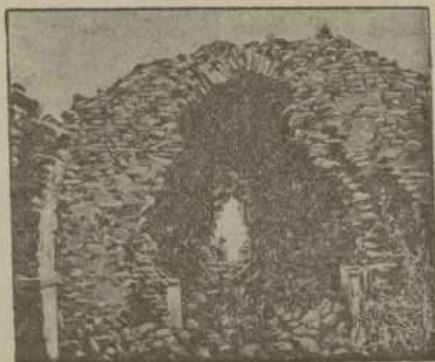
Ruinas de un templo.

La villa, lo mismo que sus habitantes y los campesinos de Liébana que se reúnen en ella los do-