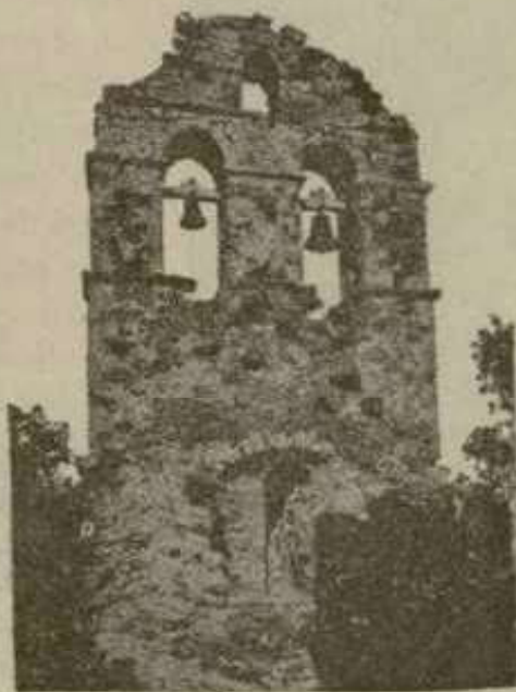
Campanario de una iglesia en Liébana.

lo apacible, de lo apropiado á la planta y á la existencia del hombre llena ¡nuestra mente. Todo te anuncia ya ¡oh deseada Potes! villa ilustre y señora de estos agrestes montes.